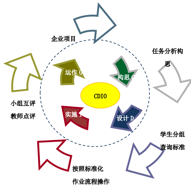
图 2 基于 CDIO 的教学模式

本专业推行项目导向、任务驱动、现场教学等“教学做”一体的教学方法,结合虚拟仿真环境与真实岗位工作流程,采用融“教学做”一体的 CDIO 教学模式,提高教学质量。